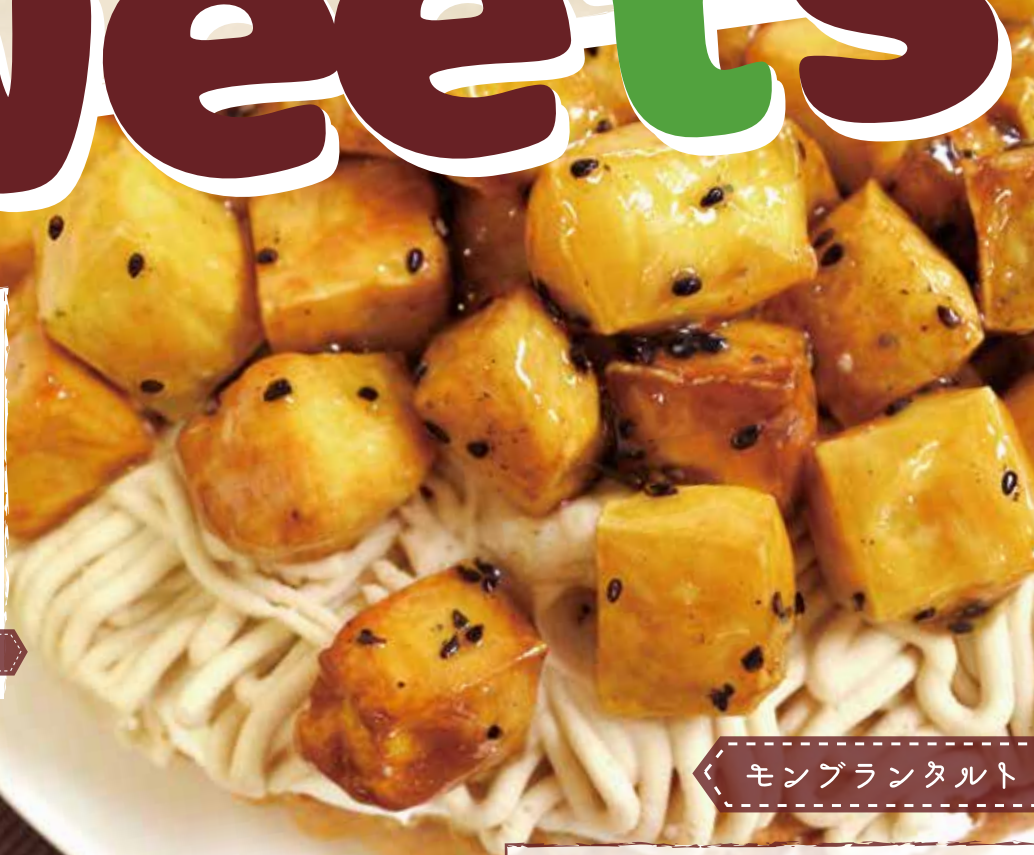
モンブランタルト