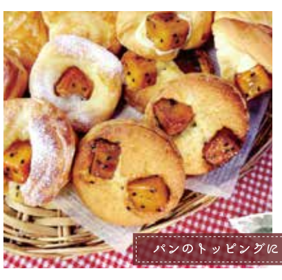
パンのトッピングに