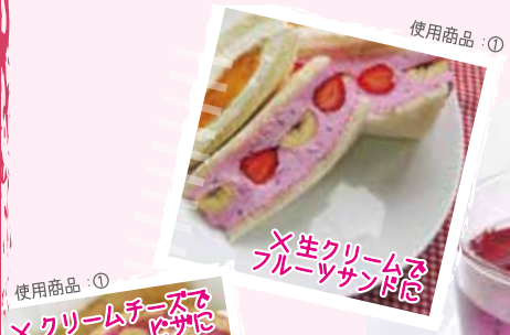
×クリームチーズで ×フルーツサンド

ほのかな甘味とポップな見た目がデザート、ドリンクにぴったりです。 500g×20入